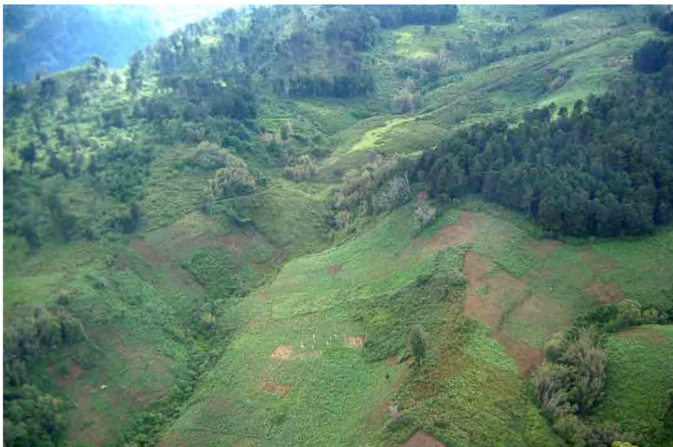
Mbica ya gatandatu: Migunda ya mutaratara wa thirikari iria itari mihande miti ihururukaini cia mwena wa irathiro