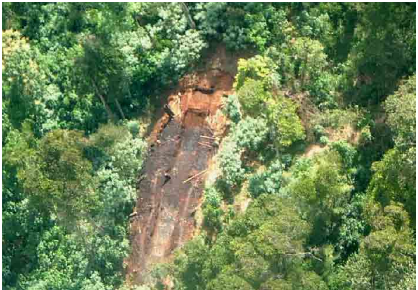
Mbica ya keru: Mumbo munene muno mwena wa guthini irathiro hakuhi na rui rwa Chania wari na githimo kia mita ithatu ukuhi na mita mirongo iri na igiri uraihu (3 x 22m).