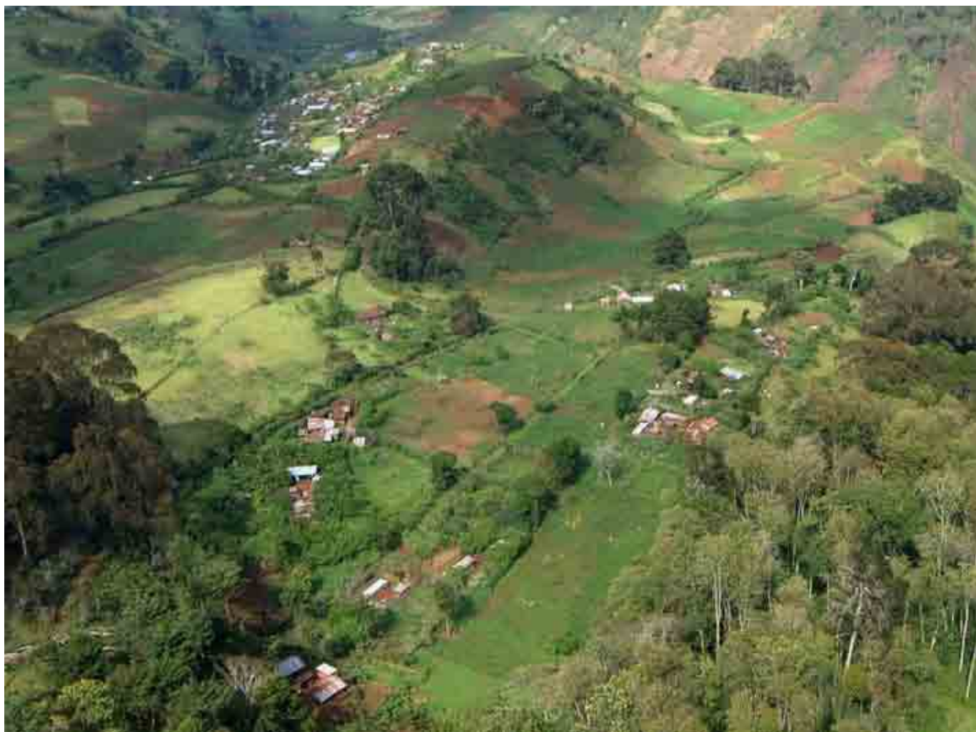
Mbica ya gatano: Micii minini thiinii wa mutitu kihururukaini mwena wa irathiro hakuhi na Kirurumi (Nyeri)