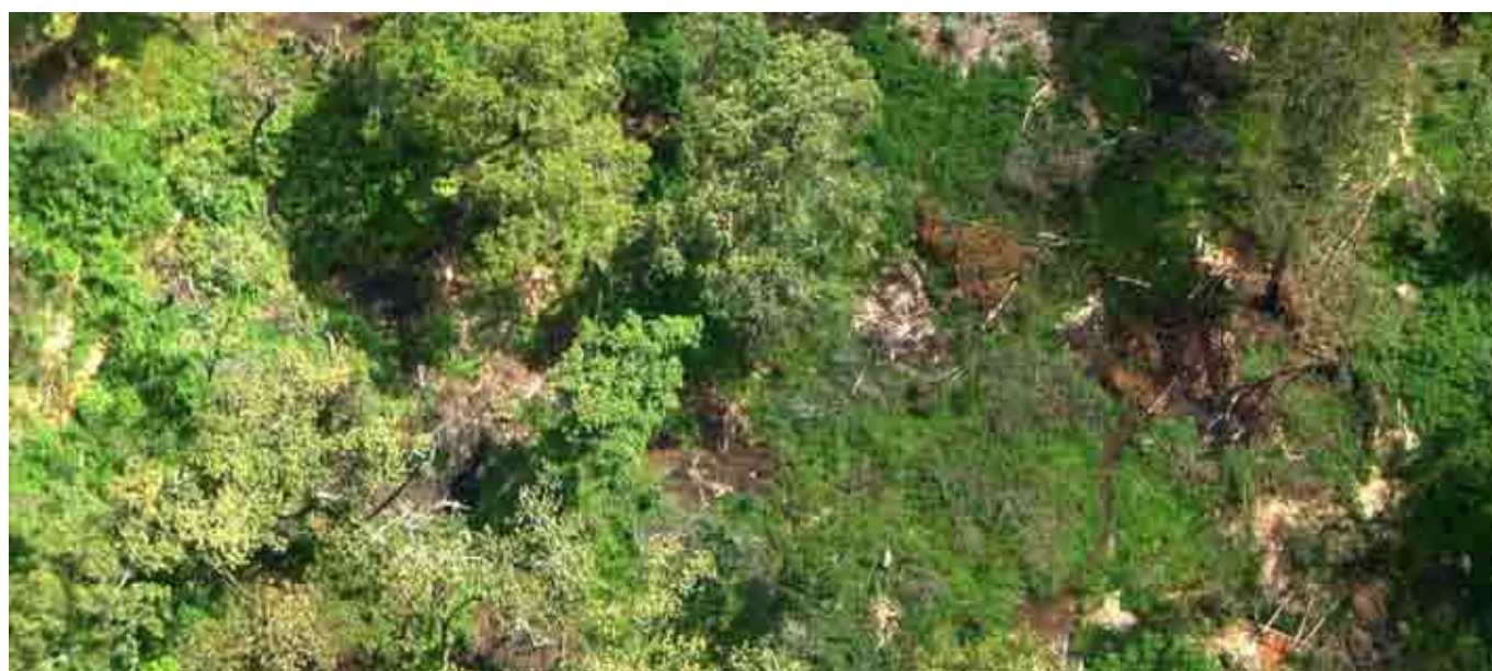
Mbica ya mbere: Mitarakwa gutemangwo mwena wa ithuiro