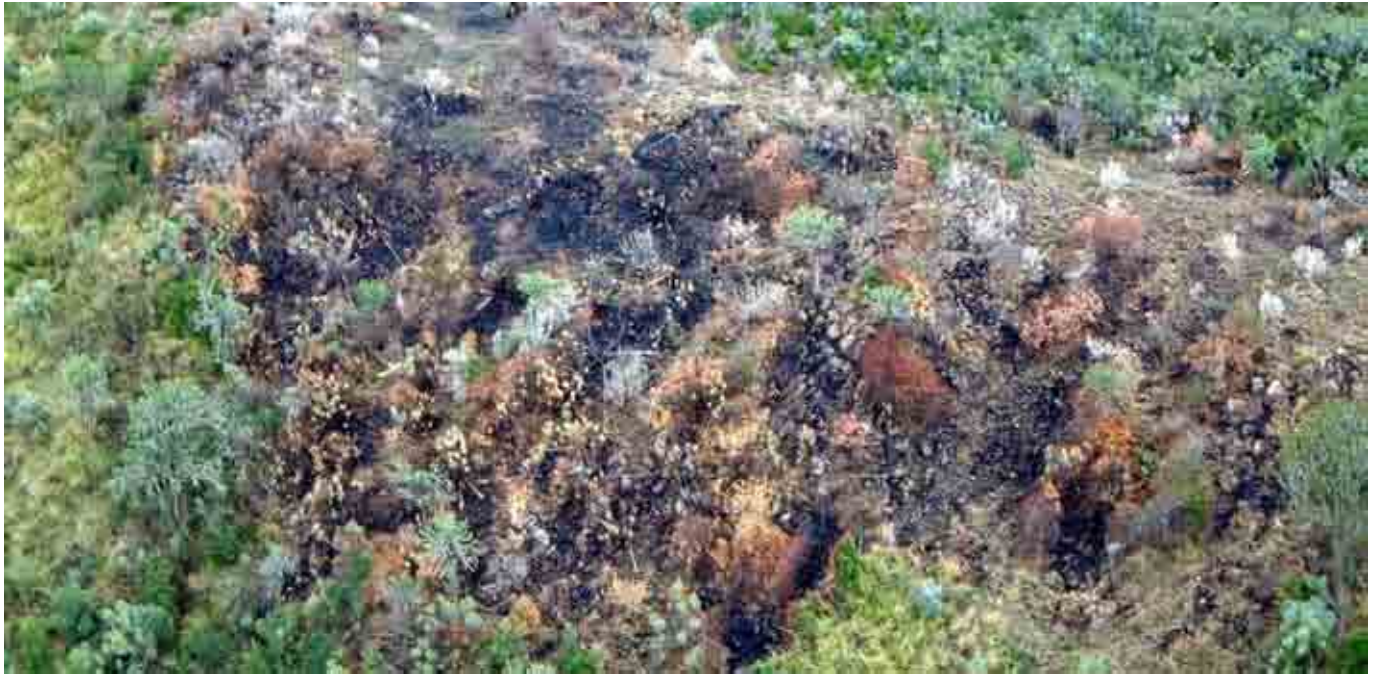
Mbica ya mugwanja: Kuria kwari kuhiu